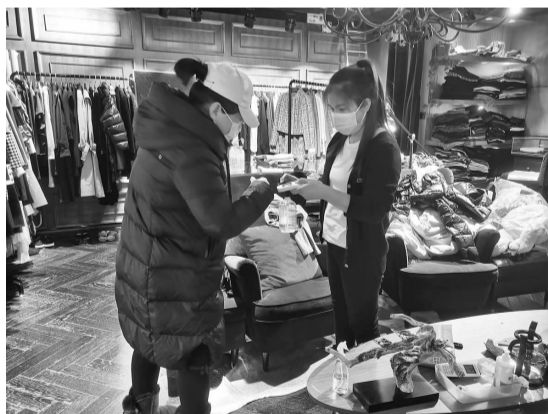
工作人员检查商户防疫工作

“您把口罩戴好,我们要进行防疫相关检查。”近期,北京及全国多地出现疫情多点散发现象。双井街道加大对辖区内各类重点人群、商户等相关单位的核酸检测以及疫情防控检查工作。同时,召开疫情防控工作会,会上街道工委书记李容珍提出三点要求:一是扎实做好常态化疫情防控工作,加强宣传引导,同时紧盯重点行业,持续强化社会面防控。二是做好春节、冬奥期间疫情防控专项督查。三是加强对核酸检测医护力量、一线工作人员、物资保障的统筹协调,加强工作统筹,各社区提前做好摸底排查和宣传发动准备工作。