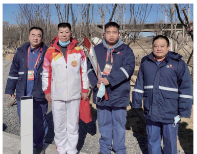
姜浩楠(右二)与“英雄团长”火炬手祁发宝的合影

姜浩楠在运送过程中,遇到担任火炬手的“卫国戍边英雄团长”祁发宝。姜浩楠说:“同样作为一名退伍军人,我非常敬佩前辈的英雄事迹,在这次活动相遇,让我倍感幸运。”