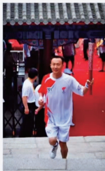
8月7日，第一棒火炬手李中华手持火炬传递。当日，北京奥运圣火在北京市传递。

结束了北京的首日的“传统文化之旅”之后，奥运火炬接力北京地区传递活动7日将进入“京郊之旅”。传递的起点设在八达岭长城广场，终点是地坛公园拜台。将有268名火参与今天的传递，首棒火炬手是英雄试飞员李中华，而点燃圣火盆的末棒火炬手则是著名歌唱家宋祖英。